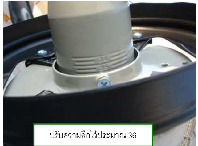
ปรับความลึกไว้ประมาณ 36