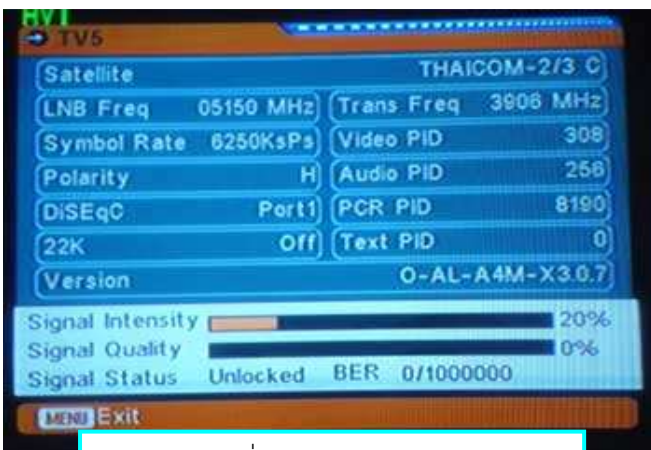
ดูสัญญาณ ที่ Quality (คุณภาพสัญญาณ)

ดูสัญญาณค่า Q ที่รีซีฟเวอร์ไปพร้อม ๆ กับการสายหน้าจาน ถ้ายังไม่มีสัญญาณขึ้น ลองปรับมุมก้มเงยขึ้นหรือลง เล็กน้อย และปรับสายหน้าจานหาอีกครั้ง (ปรับซ้ำ ๆ ใจเย็น ๆ) อย่าลืมว่าการปรับหาสัญญาณจะต้องละเอียดเป็นมิลลิเมตร ดังนั้นการให้เครื่องมือวัดมุมและเข็มทิศจะได้ค่าใกล้เคียงเพื่อที่จะหาตำแหน่งดาวเทียมได้ง่ายขึ้นเท่านั้น