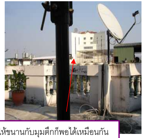
กรณีไม่มีเครื่องมือ ใช้วิธีเล็งให้ขนานกับมุมตึกก็พอได้เหมือนกัน

ประกอบจาน 4 ชิ้นเข้าด้วยกัน ประกอบคอจาน หลังจากนั้นนำคอจานประกอบเข้ากับโครงงาน ให้ได้ดังรูป