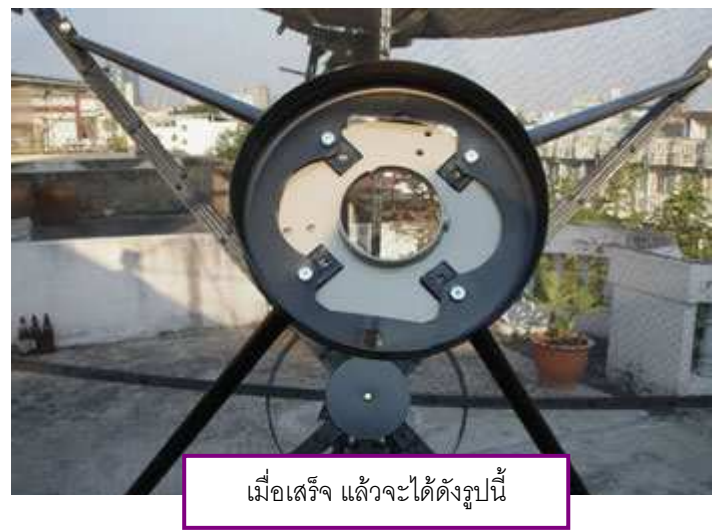
เมื่อเสร็จ แล้วจะได้ดังรูปนี้