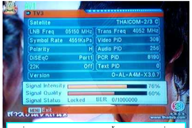
เมื่อเจอดาวเทียม ค่า Quality จะขึ้น ปรับให้ได้มากที่สุด