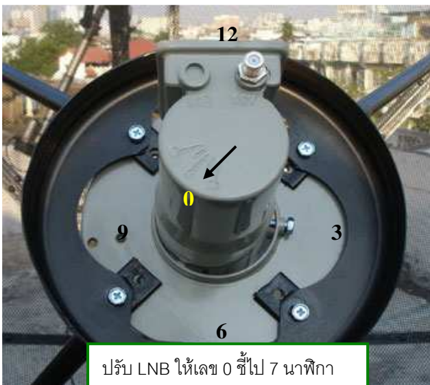
ปรับ LNB ให้เลข 0 ชี้ไป 7 นาฬิกา