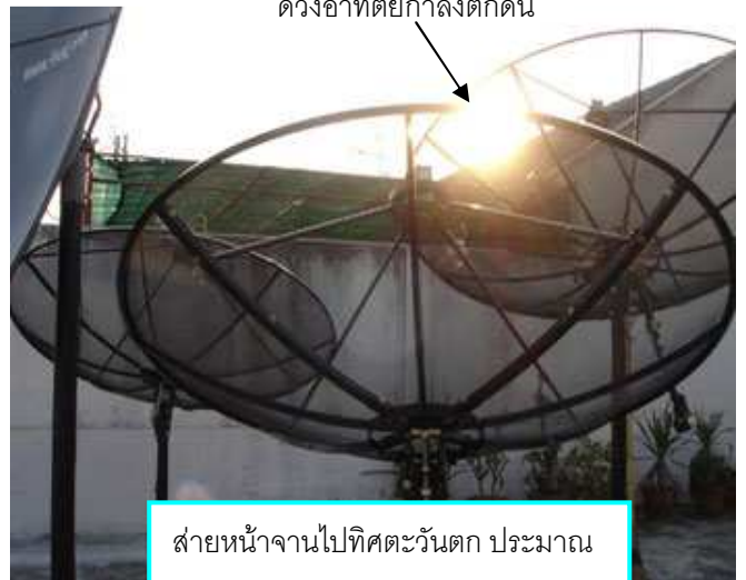
สายหน้าจานไปทิศตะวันตก ประมาณ 240 องศา (กรุงเทพฯ) โดยดูจากเข็ม

ดูสัญญาณค่า Q ที่รีซีฟเวอร์ไปพร้อม ๆ กับการสายหน้าจาน ถ้ายังไม่มีสัญญาณขึ้น ลองปรับมุมก้มเงยขึ้นหรือลง เล็กน้อย และปรับสายหน้าจานหาอีกครั้ง (ปรับซ้ำ ๆ ใจเย็น ๆ) อย่าลืมว่าการปรับหาสัญญาณจะต้องละเอียดเป็นมิลลิเมตร ดังนั้นการให้เครื่องมือวัดมุมและเข็มทิศจะได้ค่าใกล้เคียงเพื่อที่จะหาตำแหน่งดาวเทียมได้ง่ายขึ้นเท่านั้น