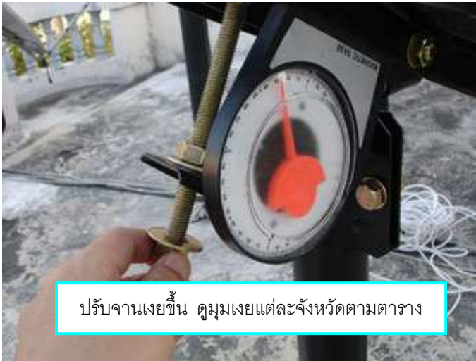
ปรับจานเงยขึ้น ดูมุมเงยแต่ละจังหวัดตามตาราง