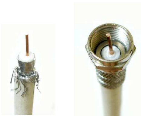
ปลอกสายและชั้นหัว F เข้าไป ดังภาพ อย่าให้ฟลวย ชนกับแกนทองแดง