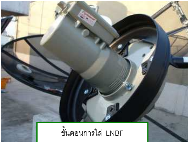
ขั้นตอนการใส่ LNB