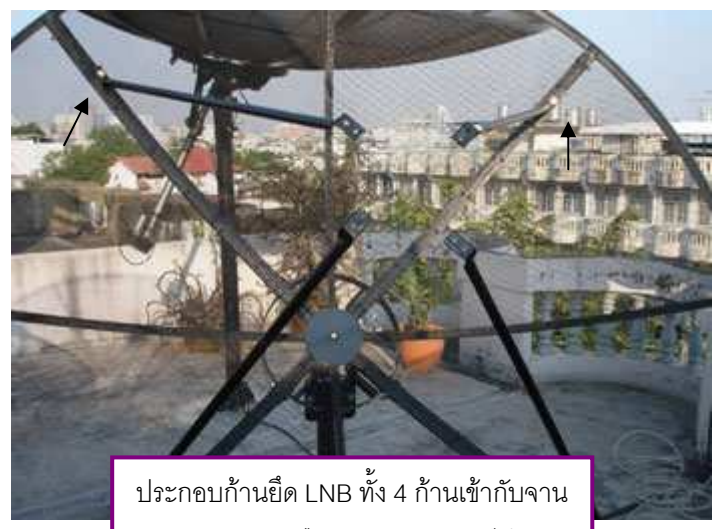
ประกอบก้านยึด LNB ทั้ง 4 ก้านเข้ากับจาน (จะใส่ก่อนหรือหลังยกสวมนเสาก็ได้)