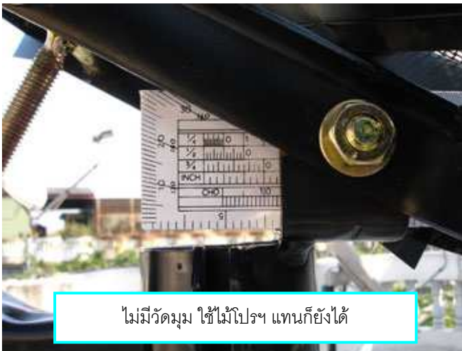
ไม่มีวัดมุม ใช้ไม้โปรย แทนก็ทำได้