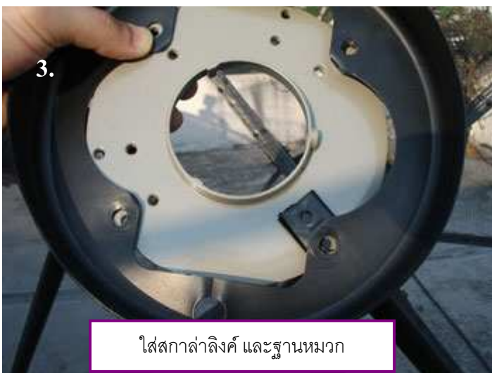
ใส่สกลาลิ่งค์ และฐานหมวก