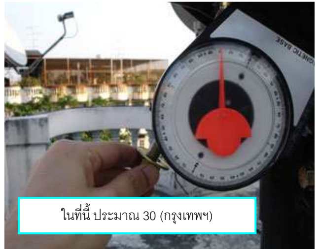
ในที่นี้ ประมาณ 30 (กรุงเทพฯ)