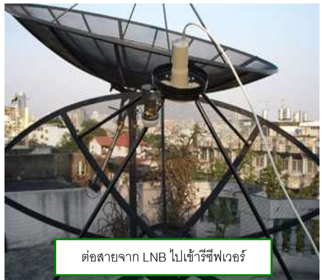
ต่อสายจาก LNB ไปเข้ารีซีฟเวอร์