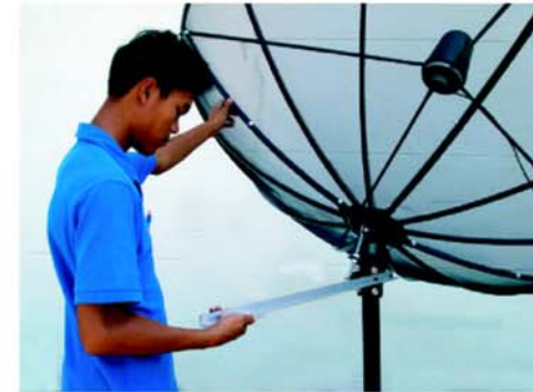
ผลักจานไปทางด้านซ้ายหรือขวา