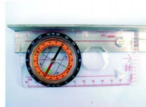
เข็มสีแดงชี้ไปที่ตัวอักษร "N" ของแถบวงกลมสีส้มพอดี